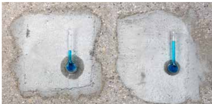
沒有使用 SikaLatex® 的砂漿