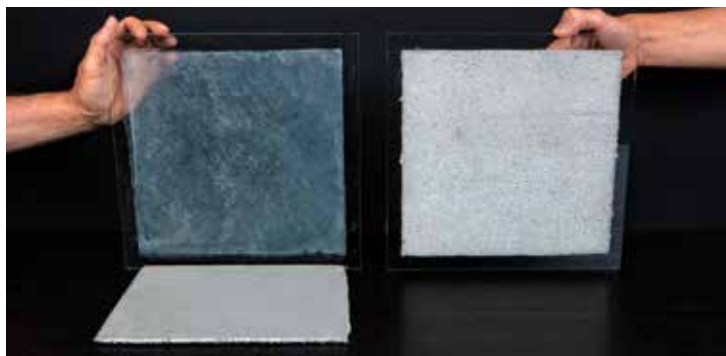
沒有使用 SikaLatex® 的砂漿